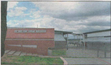
Favoriser les activités à l'intérieur du collège sera peut-être la solution...

Face à la décision du syndicat des transports des collèges de Barjols et de Vinon de faire désormais payer le kilomètre, le principal refuse d'émettre un commentaire. Il doit s'adapter. Et trouver des solutions. « Nous allons devoir en priorité favoriser les activités à l'intérieur du collège », résume le principal avant de préciser : « Il y a des solutions pour s'en sortir : anticiper nos projets et bien les ficeler afin de monter des dossiers spécifiques d'aides ». « En résumé, nous allons devoir changer nos habitudes... »